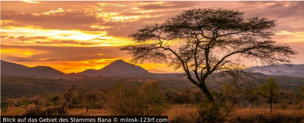
Blick auf das Gebiet des Stammes Bana