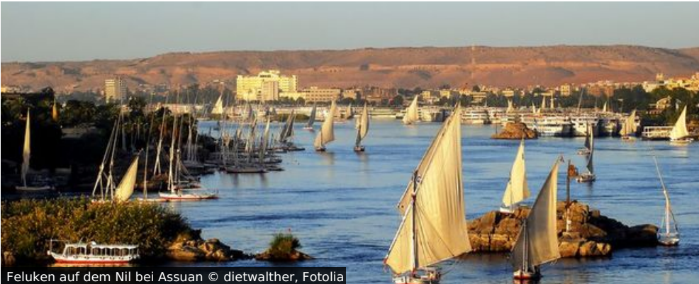
Feluken auf dem Nil bei Assuan