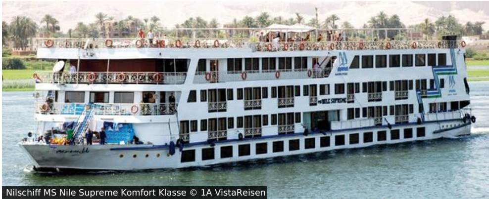
Nilschiff MS Nile Supreme Komfort Klasse