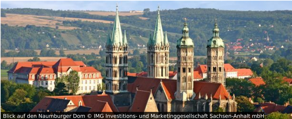
Blick auf den Naumburger Dom