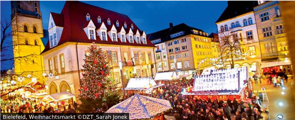
Bielefeld, Weihnachtsmarkt