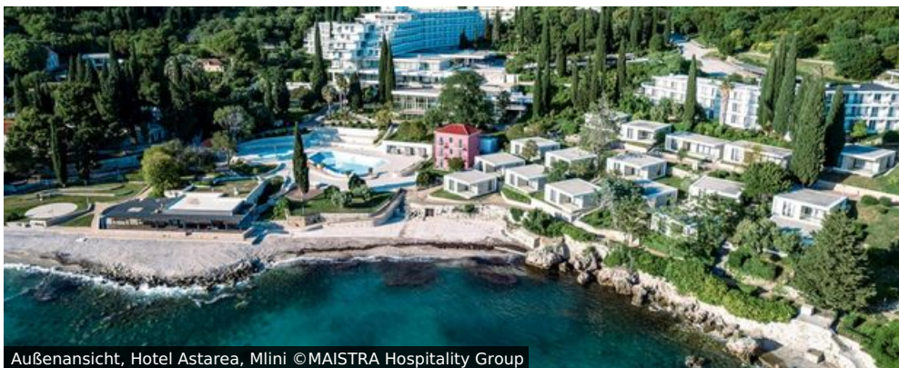
Außenansicht, Hotel Astarea, Mlini