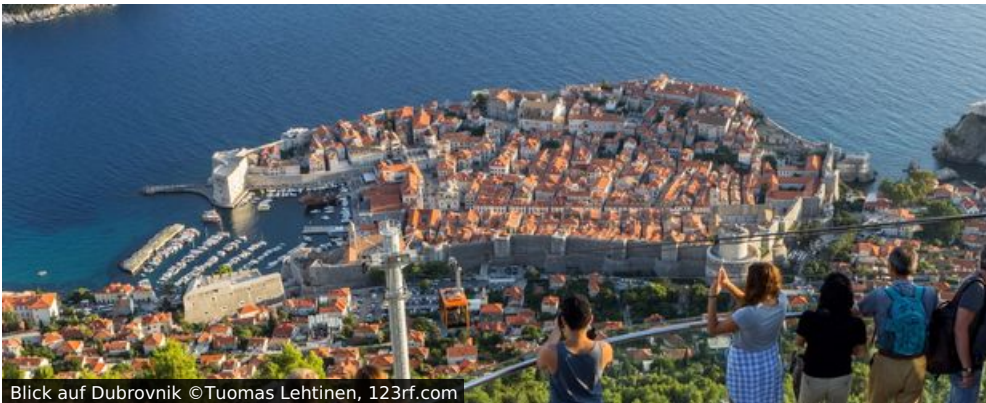
Blick auf Dubrovnik