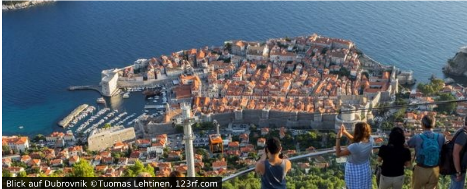
Blick auf Dubrovnik