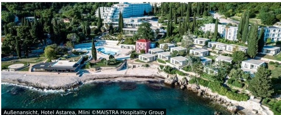
Außenansicht, Hotel Astarea, Mlini