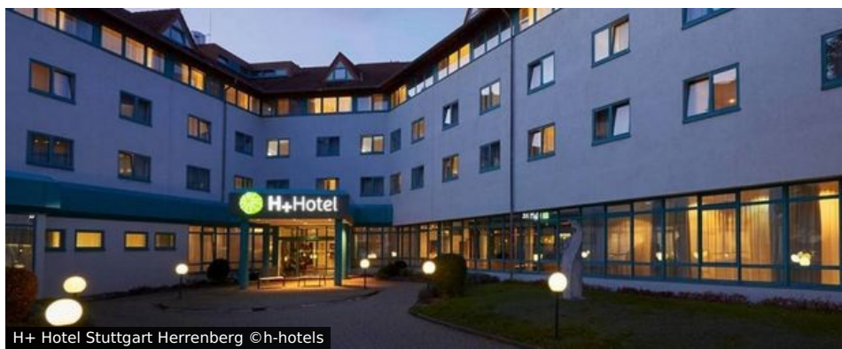
H+ Hotel Stuttgart Herrenberg