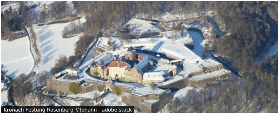
Kronach Festung Rosenberg