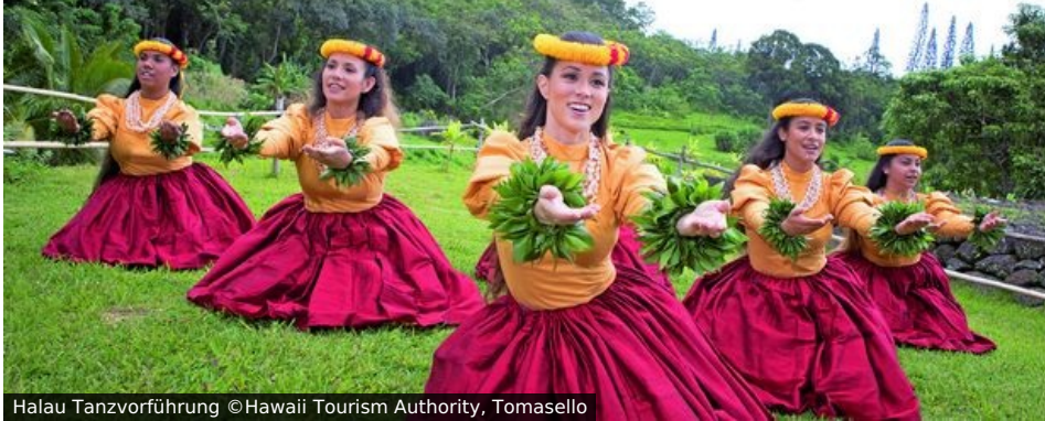
Halau Tanzvorführung