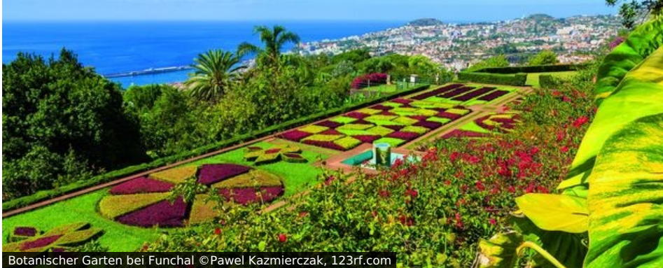
Botanischer Garten bei Funchal