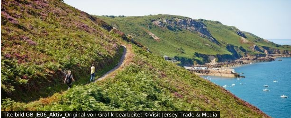
Titelbild GB-JE06_Aktiv_Original von Grafik bearbeitet ©Visit Jersey Trade &amp; Media