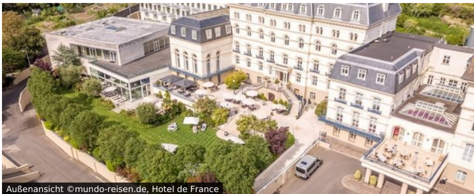
Außenansicht Hotel de France