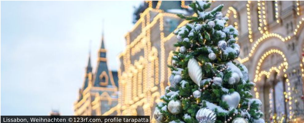
Lissabon, Weihnachten