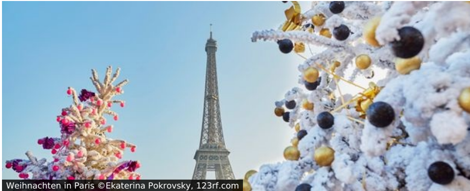
Weihnachten in Paris