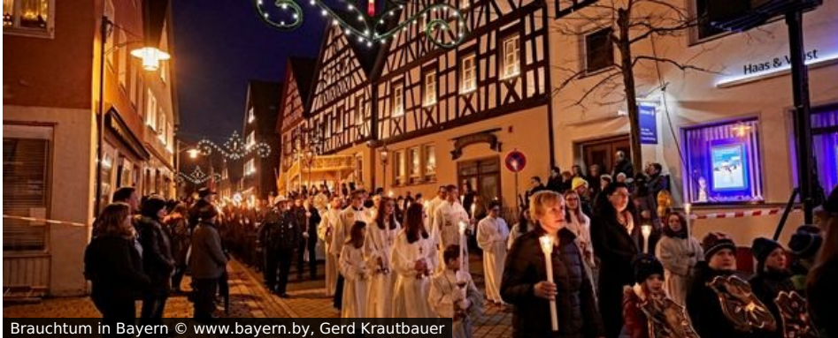
Brauchtum in Bayern