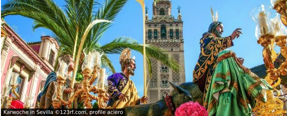
Karwoche in Sevilla