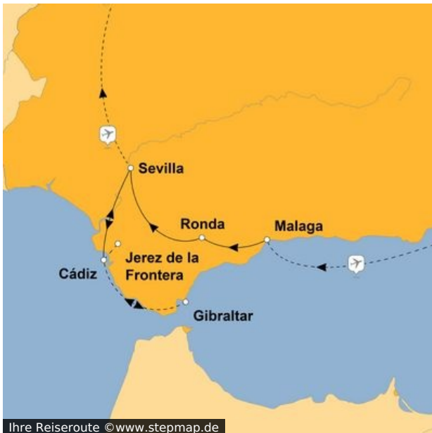
Ihre Reiseroute

Der Süden Spaniens ist gerade in der Osterwoche nicht nur meteorologisch ein ganz heißer Urlaubstipp. Denn in den Städten und Landstrichen Andalusiens mischen sich spanische Kultur und Lebensgefühl auf zauberhafte Weise mit den Hinterlassenschaften der verschiedensten Einflüsse, die Eroberer und Missionare über die Jahrtausende hierherbrachten.