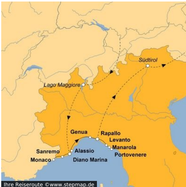
Ihre Reiseroute

Als Gott die Schöpfung betrachtete, dachte er: "Hier und da könnten ein paar Highlights noch ganz guttun!" So tunkte er seinen Pinsel ein letztes Mal in den Topf mit allen Farben und tupfte sie voller Übermut an die Küste Liguriens. Wollen Sie sich das nicht auch mal aus der Nähe betrachten? Wir bringen Sie hin!