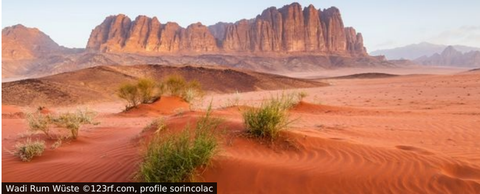
Wadi Rum Wüste