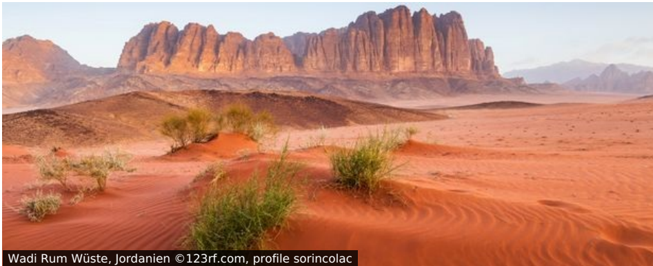
Wadi Rum Wüste, Jordanien