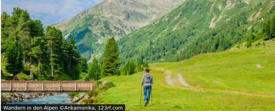
Wandern in den Alpen