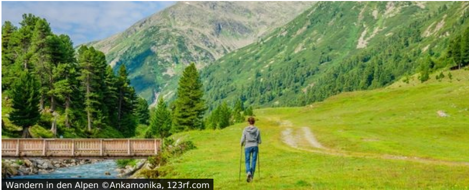
Wandern in den Alpen