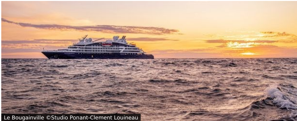
Le Bougainville