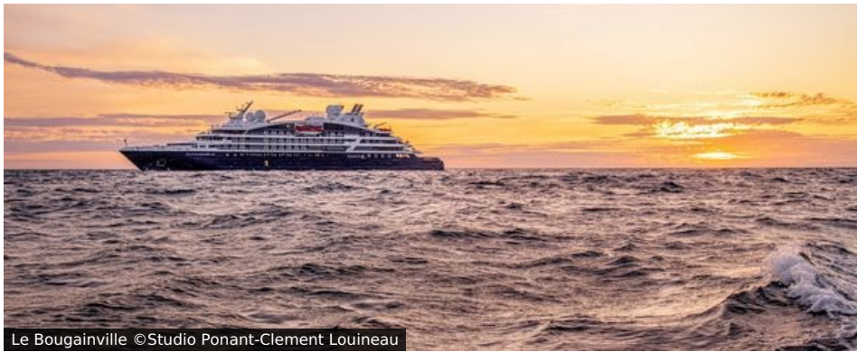
Le Bougainville

Gemütliche und gut belüftete Gemeinschaftsräume, puristisches Design und Blick aufs Meer, markante Außenlinien, eine Marina, die den Zodiac®-Schlauchbooten Ausfahrt und Rückkehr erleichtert, HiTech-Ausrüstung, ein Außenpool, ein multisensorischer Unterwassersalon... Le Bougainville repräsentiert die neue Schiffsgeneration, die Entdeckung und Luxus auch in den abgelegensten Weltgegenden verbindet.