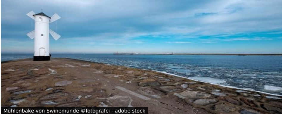
Mühlenbake von Swinemünde