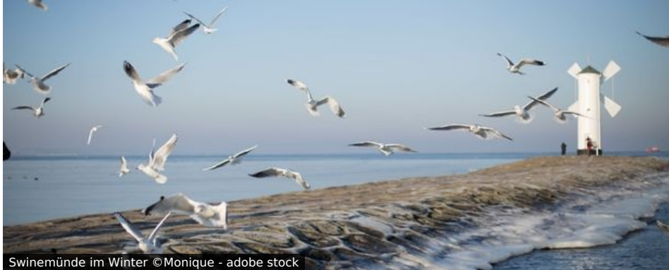
Swinemünde im Winter