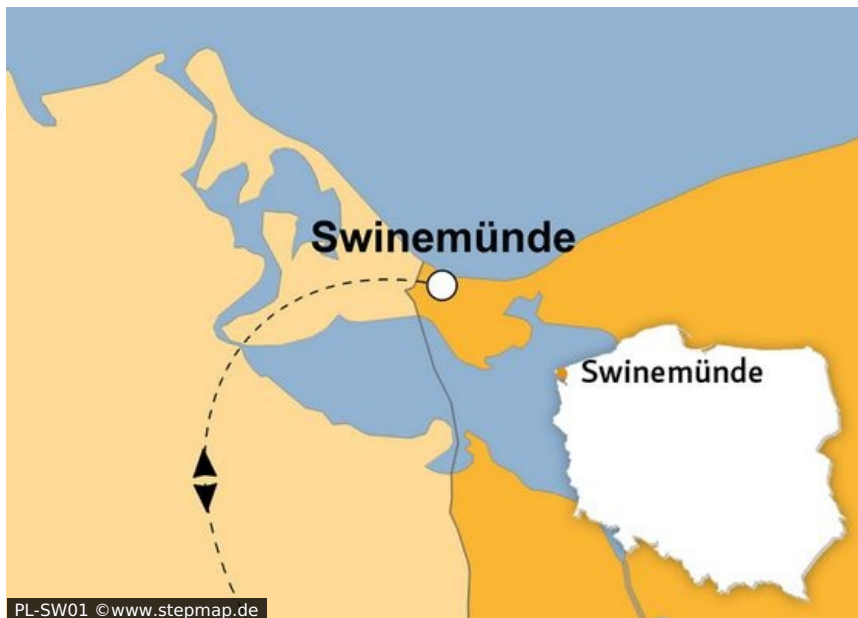
PL-SW01 © www.stepmap.de

„Hamilton oder Drei Inseln“ könnte der Titel eines spannenden Romans lauten, der Ihnen die Zeit zwischen Weihnachten und dem neuen Jahr versüßt. Schreiben werden Sie ihn selbst - und bevor Sie Ihre Geschichte eines unvergesslich schönen Silvesterurlaubs an der polnischen Ostsee erleben, müssen Sie genau diese Frage beantworten: Hamilton oder Drei Inseln? So lauten die Namen der beiden komfortablen Spa-Hotels, die wir für Ihren Silvesterurlaub reserviert haben. Modern, gehoben und mit allem ausgestattet, was ein Wellnessurlaub braucht, sind sie beide.