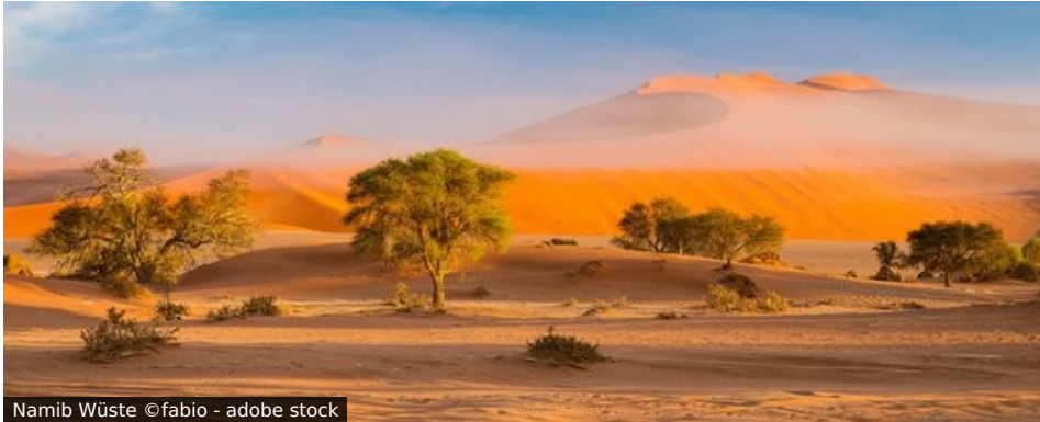
Namib Wüste