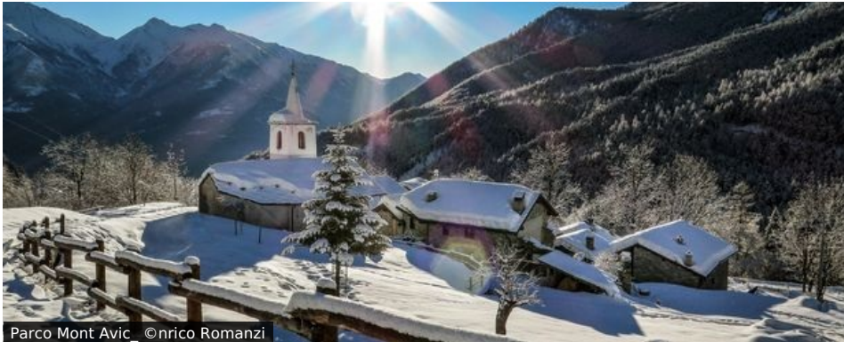
Parco Mont Avic_ ©nrico Romanzi