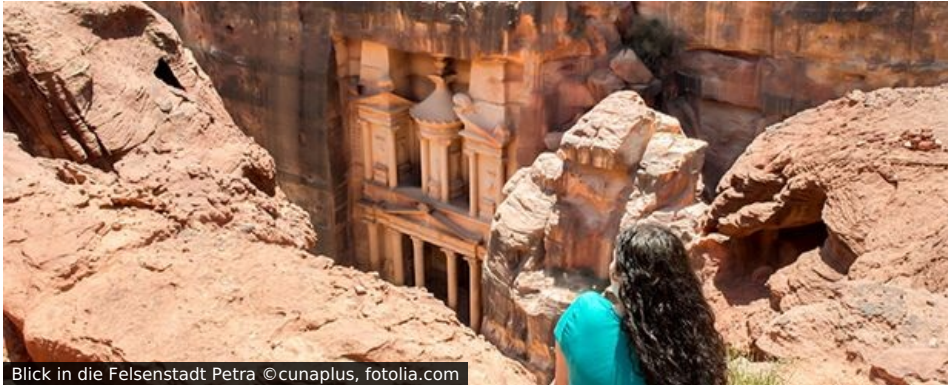
Blick in die Felsenstadt Petra