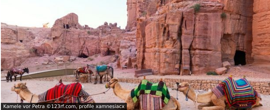
Kamele vor Petra