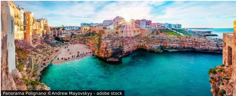
Panorama Polignano