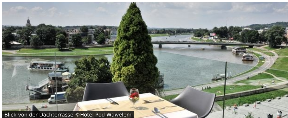
Blick von der Dachterrasse