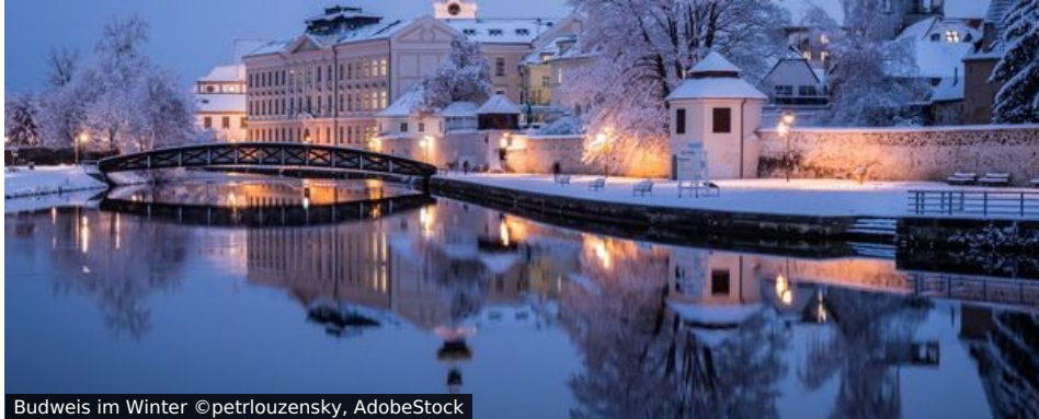
Budweis im Winter