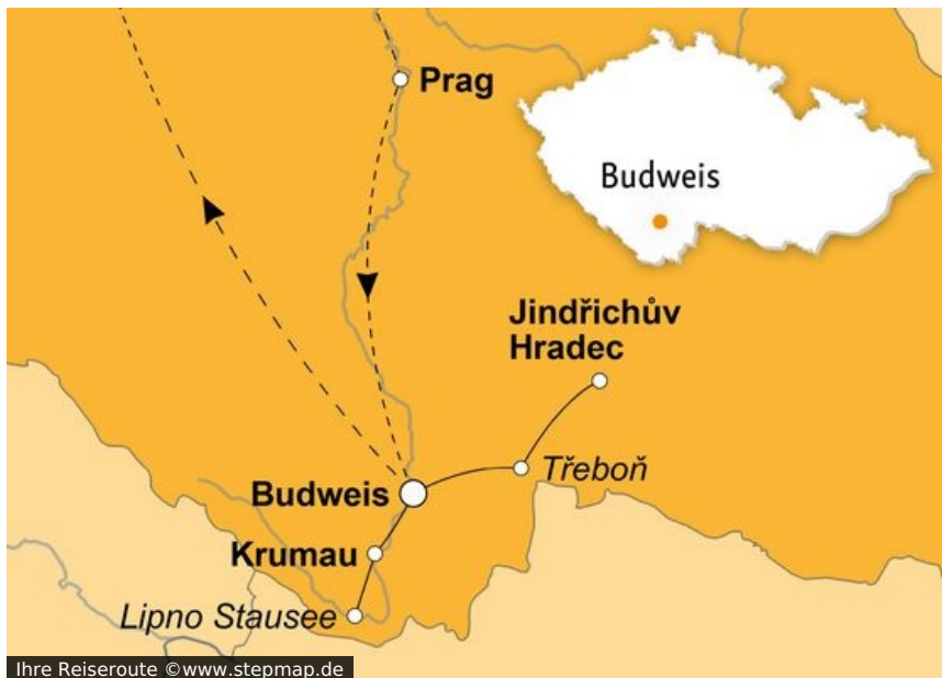
Ihre Reiseroute

Sie denken bei Weihnachten nicht unbedingt an ein kühles Blondes? Seien Sie gewiss, Sie werden es sich anders überlegen, denn bei unserer Reise durch Südböhmen werden Sie die Bierstadt Budweis gewiss nicht ohne einen Schluck des weltberühmten Gerstensaftes verlassen wollen.