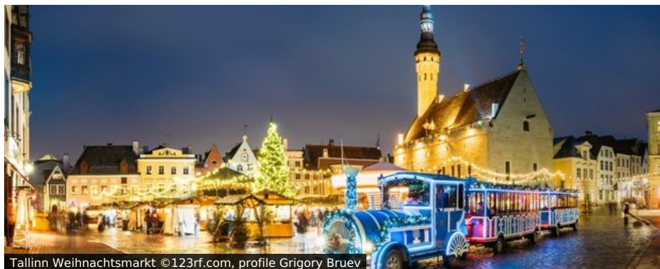
Tallinn Weihnachtsmarkt

Wenn Kerzen und Lichter die Fenster und Straßen erleuchten, dann ist Weihnachten nicht mehr weit. Tallinn im Nordosten Europas zeigt sich dann von seiner festlichsten Seite und im winterlichen Gewand. Und mit Helsinki vielleicht dazu (?) erwarten Sie gleich zwei Stadtschönheiten bei dieser Reise - voller mittelalterlicher Architektur, moderner Lebensart und gespickt mit Adventsidylle.