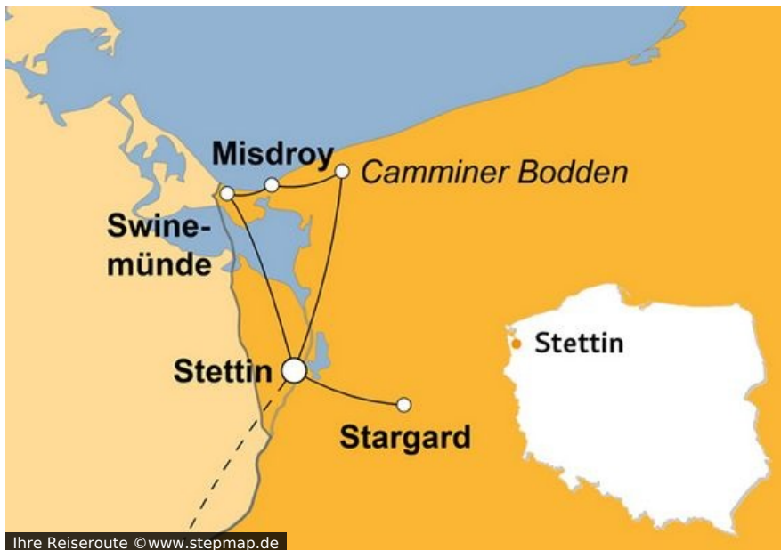
Ihre Reiseroute

Eine doppelte Grenzerfahrung der angenehmsten Sorte erwartet Sie auf dieser Silvesterreise nach Stettin. Denn Sie überschreiten nicht nur die Jahresgrenze, sondern auch die zwischen Deutschland und Polen – Letztere gleich mehrfach.