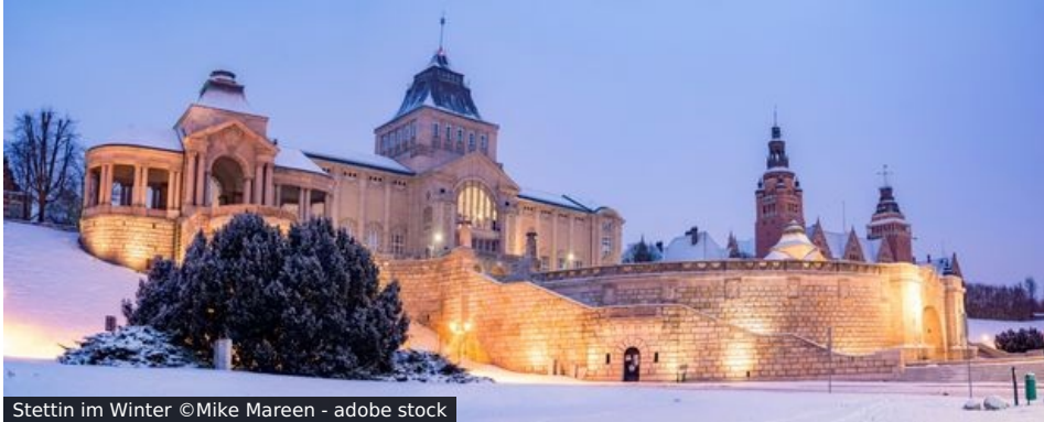
Stettin im Winter