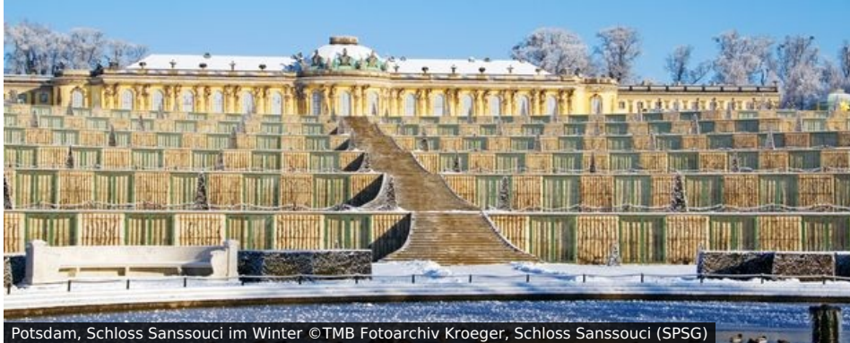
Potsdam, Schloss Sanssouci im Winter