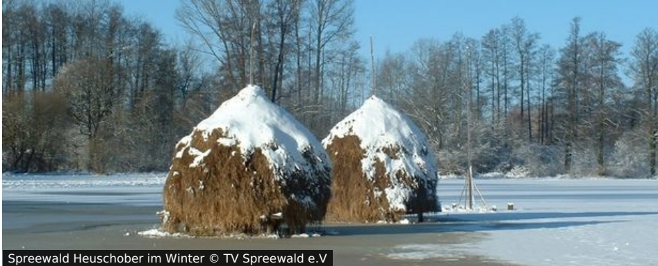
Spreewald Heuschober im Winter