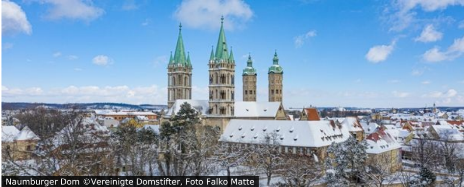
Naumburger Dom