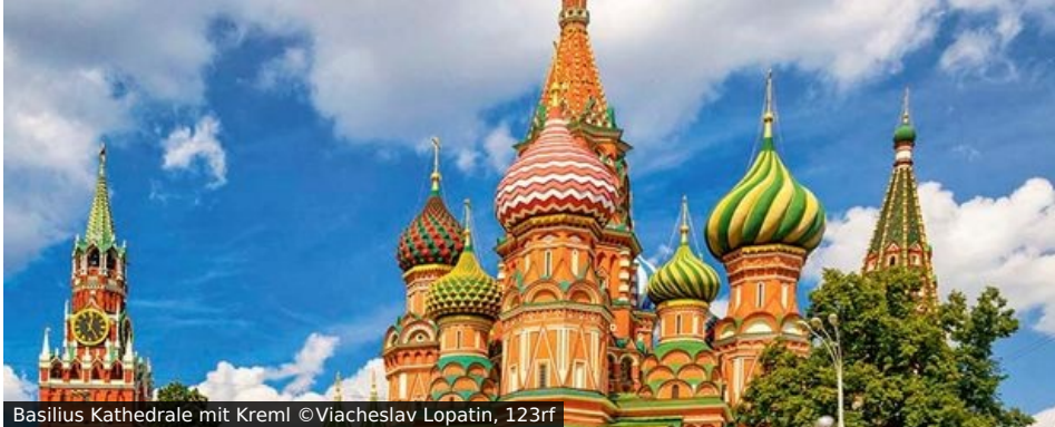
Basilikus Kathedrale mit Kreml