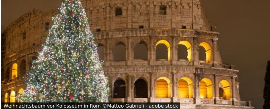
Weihnachtsbaum vor Kolosseum in Rom

Rom wäre nicht die Metropole der christlichen Kirche, wenn die Ewige Stadt sich nicht gleichzeitig als Weihnachtshauptstadt Europas zeigte. Und während sich Rom zu anderen Jahreszeiten vor allem quirlig und weltstädtisch gibt, legt sich ab dem 8. Dezember - mit dem Fest Mariä Empfängnis - tatsächlich der Zauber des Weihnachtsfestes über all seine Hügel.