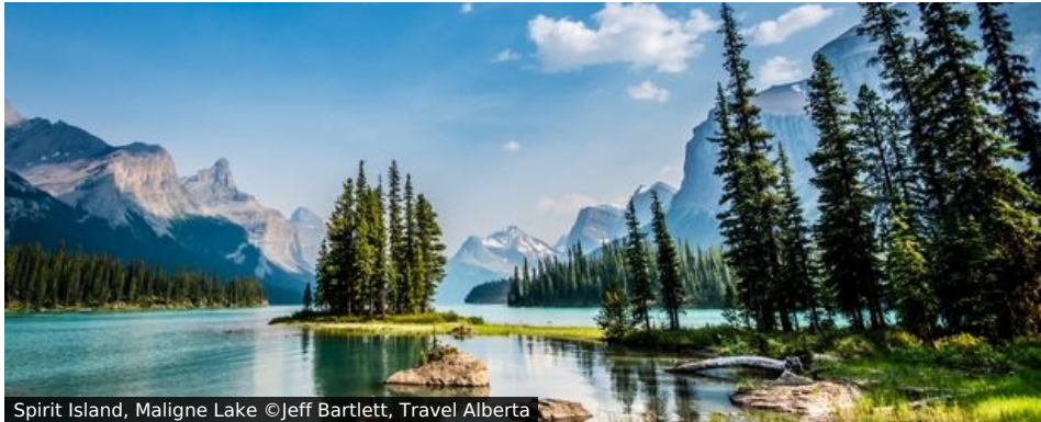
Spirit Island, Maligne Lake